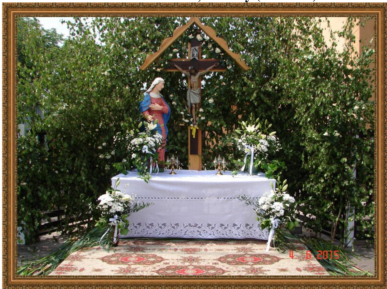
Oltarz 1. ul.Gaikowa, P.Cichy (foto 1 i 2)